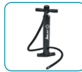
Bomba de alta presión