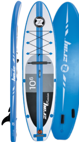
Tabla de paddle surf Premium versátil estable y de alto rendimiento La tabla de paddle surf Zray Premium A2, de mayor anchura (81 cm) y longitud (320 cm), garantiza una estabilidad y solidez magníficas. Fabricada a partir de los mejores materiales, esta tabla de paddle surf ofrece un rendimiento excelente y una experiencia insuperable para dar largos paseos o disfrutar de sesiones de fitness e incluso de velocidad. Bien equipada y sencilla de transportar, esta tabla permitirá a los deportistas descubrir el mundo desde una perspectiva totalmente.