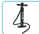
Bomba de alta presión