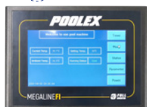
Grande pannello di controllo a colori