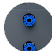
Raccordi di grande diametro per piscine professionali