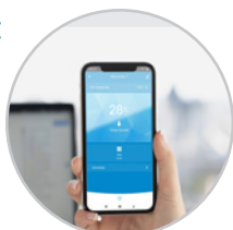
Connessione WiFi per il controllo remoto