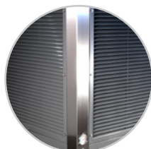
Struttura in acciaio inossidabile resistente alla corrosione