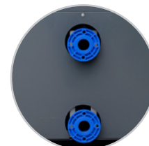
Armaturen mit großem Durchmesser für professionelle Pools