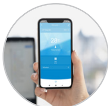
WiFi-Verbindung zur Fernbedienung