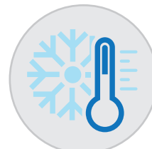
Breites Einsatzspektrum bis auf -15 °C